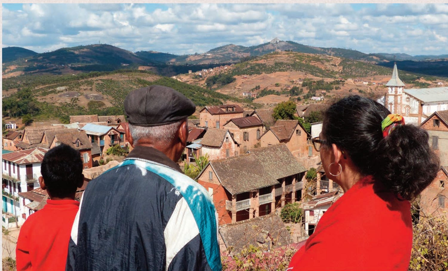
Ambatomanga, août 2015.

Si le film pouvait contribuer à faire émerger les conversations dans les familles, ce serait effectivement une bonne chose. Certains ignorent que leurs grand-parents ou même que leurs parents ont été directement touchés par la répression et par les crimes de guerre. Les récits sont parfois difficiles et douloureux mais ce questionnement est nécessaire et salutaire, à l'instar d'une thérapie. Le film n'est pas là pour délivrer un message, mais pour engager l'autre à s'interroger, à poser des questions. En parler est important car la parole peut nous aider à surmonter le deuil.