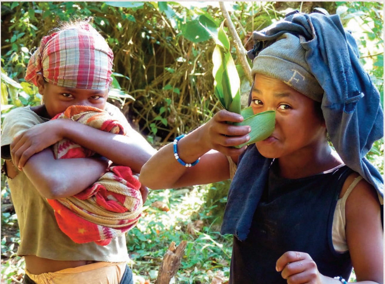
Andrambovato, août 2015. Libation

En août 1946, des milliers de soldats malgaches enrôlés dans l'armée française rentrent enfin à Madagascar, convaincus que de Gaulle va leur donner l'indépendance. Quand ils sont renvoyés dans les plantations coloniales, certains prennent la tête d'une insurrection, violemment réprimée par les autorités françaises. Les rebelles résistent pendant dix-huit mois dans la forêt, galvanisés par les chamanes et le savoir-faire des anciens combattants de la Seconde Guerre mondiale.