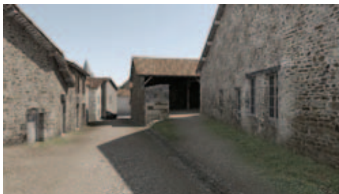
Reconstitution 3D de la grange Laudy