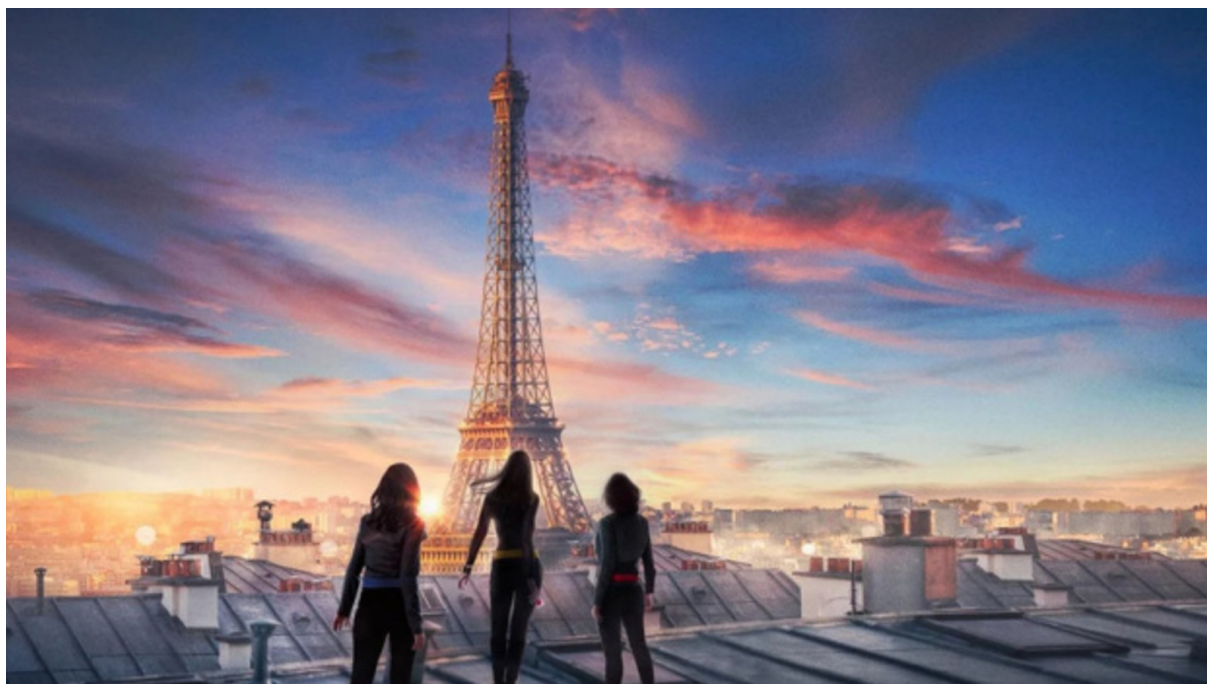
'Cat's Eye'