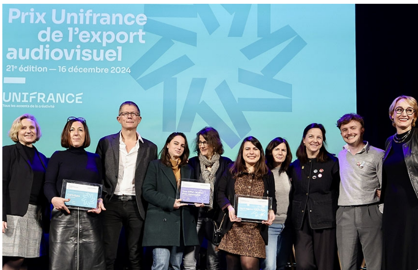
21st Unifrance TV Export Awards