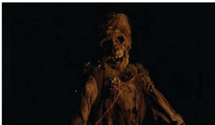
(/uploads/image/001/412/la-corde-photo-1412361.png) Sympathique conversation au coin du feu

Ce qu'elle a à en dire est moins puissant et comparé à la quête existentielle des autres protagonistes, la volonté de réussite des personnages a surtout beaucoup de mal à être vraiment crédible quand elle est enfermée entre ces quatre murs, surtout qu'elle est assaisonnée d'un trio amoureux mal amené et mal utilisé. Et cela n'a rien à voir avec le jeu des acteurs qui, là aussi, reste subtil et réaliste. L'errance dans la forêt éclipe tout, cette moisson tant attendue, l'enquête policière... tout est balayé d'un tel revers de main qu'on en viendrait à regretter que La Corde ne soit pas un simple huis clos sous la canopée norvégienne.