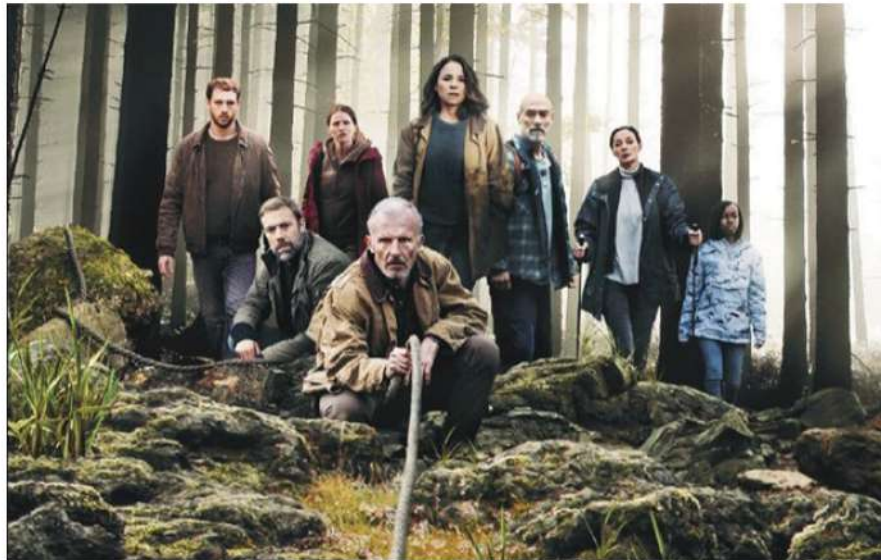
French scripted series The Rope

NEWS BRIEF: French distributor Wild Bunch TV has secured the global sales rights for French scripted series The Rope , a copro between French channel Arte, French prodco Les Films de l'Instant and Belgian's Versus Production.