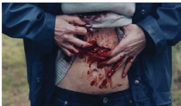
(/uploads/image/001/412/la-corde-photo-1412359.png) Métaphore d'un cancer