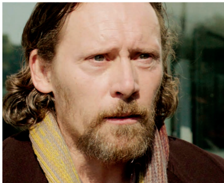
Francis Renaud / Le Maire Un Village Français, 36 Quai des Orfèvres