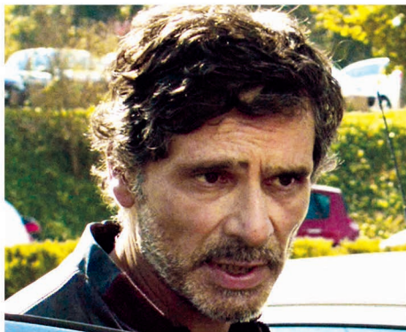
Pascal Elbé / Le commissaire Baron Noir, Comme les Autres, Père et Fils