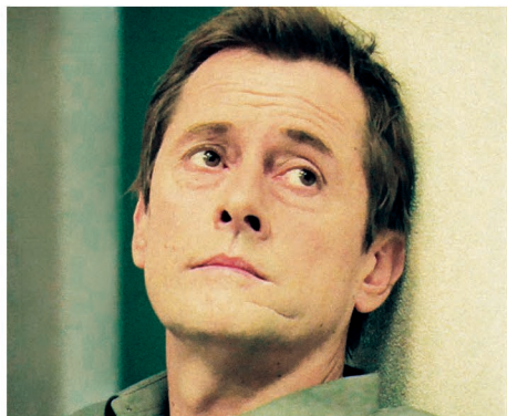
Jean-Michel Fête / Franck Un Village Français, Go Fast