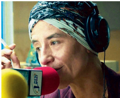
Romane Bohringer / Max Le Bal des Actrices, L'Accompagnatrice