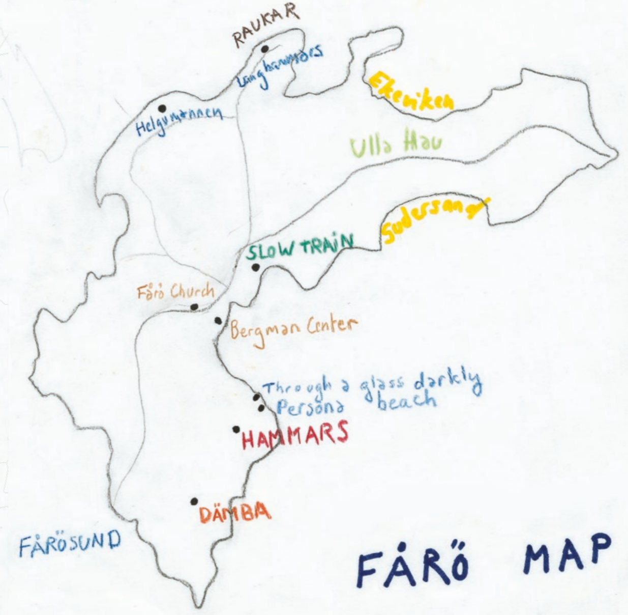
Carte des lieux de tournage de BERGMAN ISLAND dessinée par MIA HANSEN-LØVE