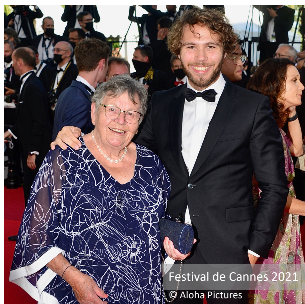
Festival de Cannes 2021

Les retours ont été très enthousiastes en festivals en 2021 (Nikon Film Festival, Short Film Corner à Cannes, Festival International du Film de Saint-Jean-de-Luz) et nous avons donc été encouragés à diffuser le film encore plus loin .