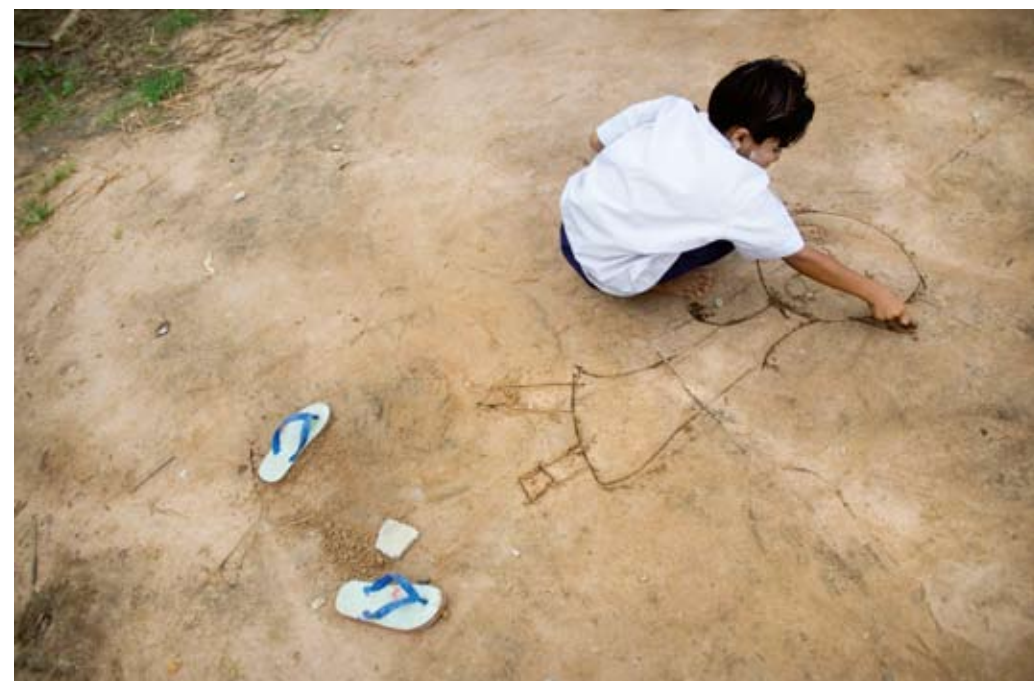
Ce Dar Be 6 ans | Birmanie

Mai 2010 | La démarche Portraits/Autoportraits est placée sous l'égide officielle de l'Unesco.