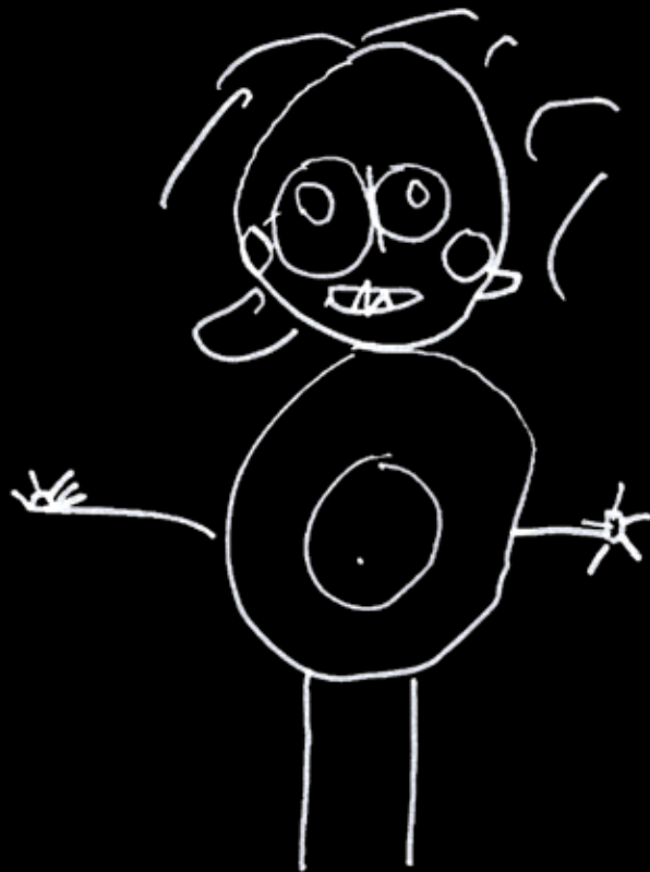
Gilles par Syrine, 4 ans et 5 mois