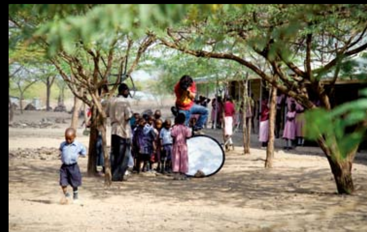
Séance photo | Kenya