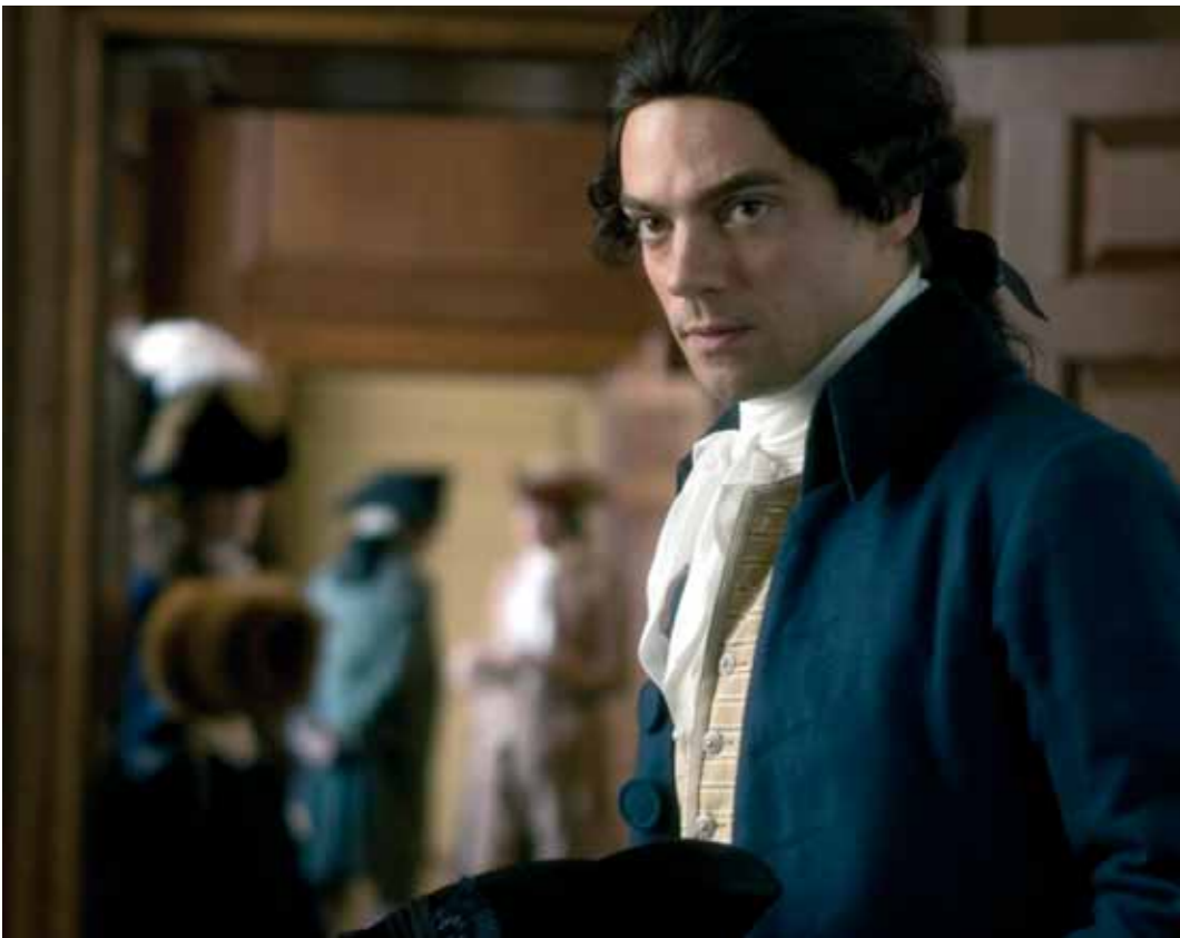
DOMINIC COOPER Charles Grey

Formé à la London Academy of Music and Dramatic Art, on a pu le voir dans BREAKFAST ON PLUTO de Neil Jordan, FROM HELL des frères Hughes, STARTER FOR TEN de Tom Vaughn avec James McAvoy, et dernièrement MAMMA MIA! de Phyllida Lloyd, avec Meryl Streep et Colin Firth. Il a tourné depuis AN EDUCATION de Lone Scherfig, sur un scénario de Nick Hornby, et jouera prochainement Steerforth dans DAVID COPPERFIELD de Peter Howitt.