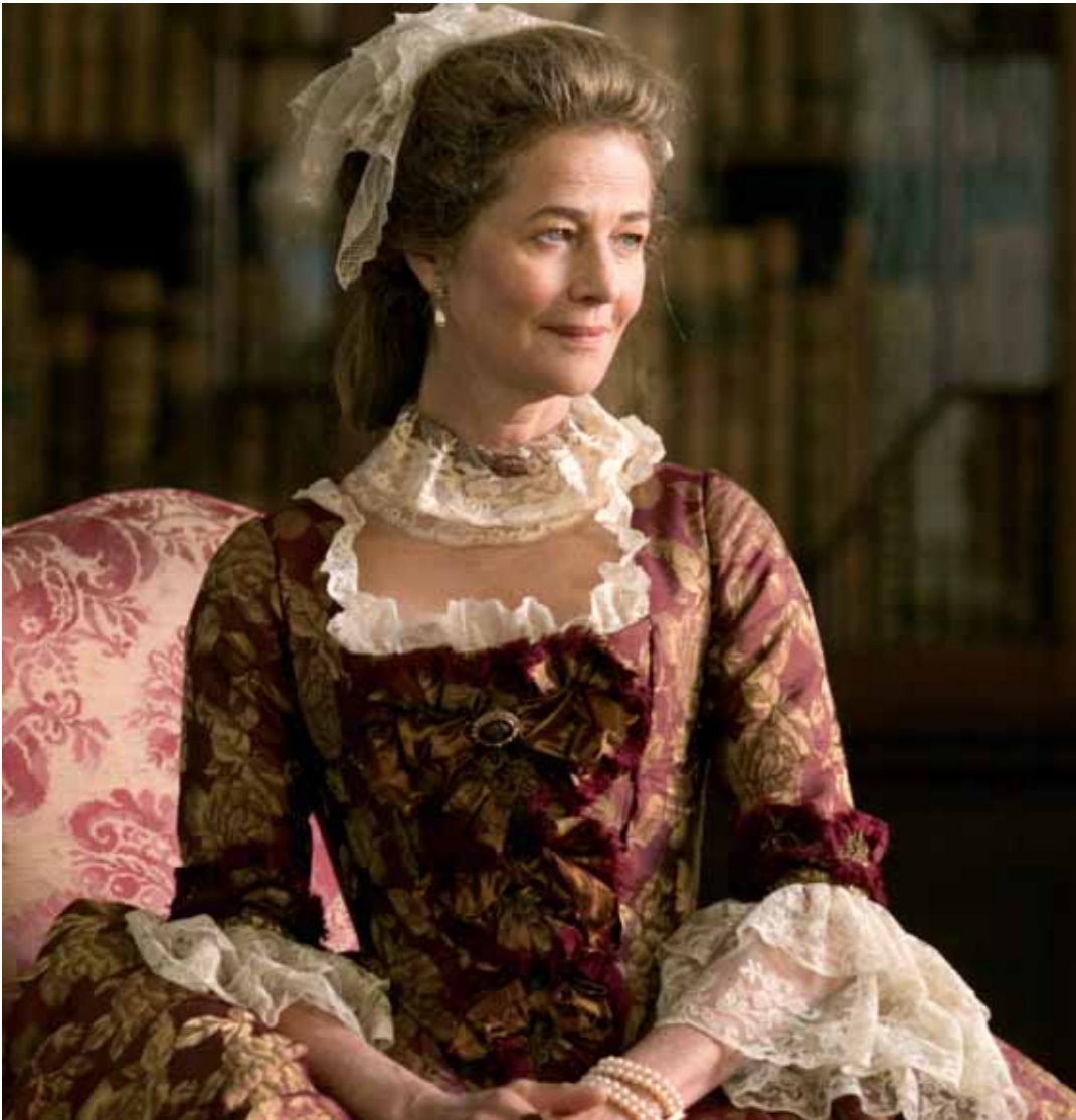
CHARLOTTE RAMPLING Lady Spencer

Depuis ses débuts d'actrice en 1964 dans LE KNACK OU COMMENT L'AVOIR sous la direction de Richard Lester, Charlotte Rampling s'est imposée comme l'une des plus célèbres actrices européennes.