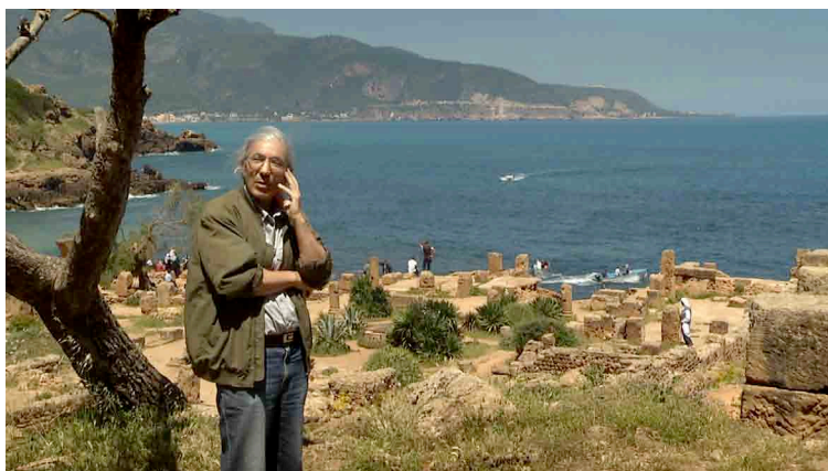
Boualem Sansal à Tipasa

On voit cet effort d'améliorer la situation, un effort continu qui arrive quelques fois à trouver une solution plus ou moins acceptable... et ensuite tout dégringole à nouveau. »