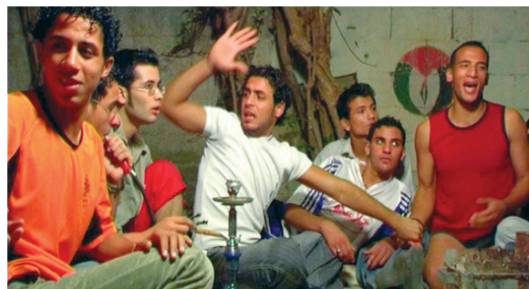
CHACUN SA PALESTINE de Nadine Naous et Léna Rouxel