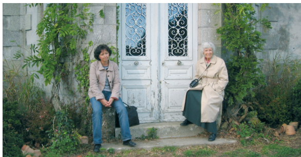
LE CHANT DE LA BALEINE de Catherine Bernstein