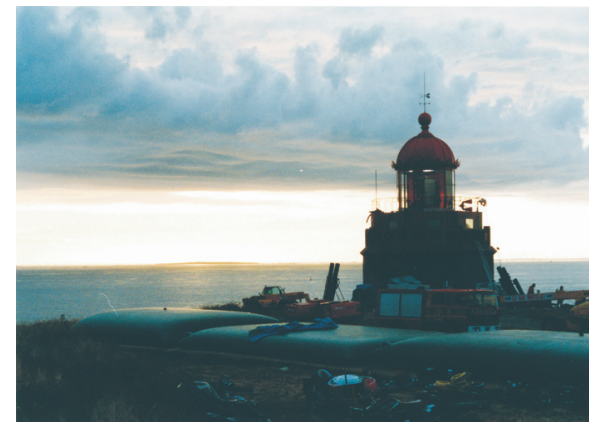
Sur le tournage de L'ÉQUIPIER de Philippe Lioret

Tous ces films ont été sélectionnés et plusieurs fois primés dans des festivals de cinéma nationaux et internationaux : Cannes, Brest, Clermont-ferrand, Pantin, Bruxelles, Berlin, Montecatini, Shanghai. Ils ont été diffusés sur des chaînes nationales, Arte, Canal +, France 2, France 3, des chaînes régionales France 3 Ouest et sur le câble, Odyssée, TV Rennes, TV Breizh.