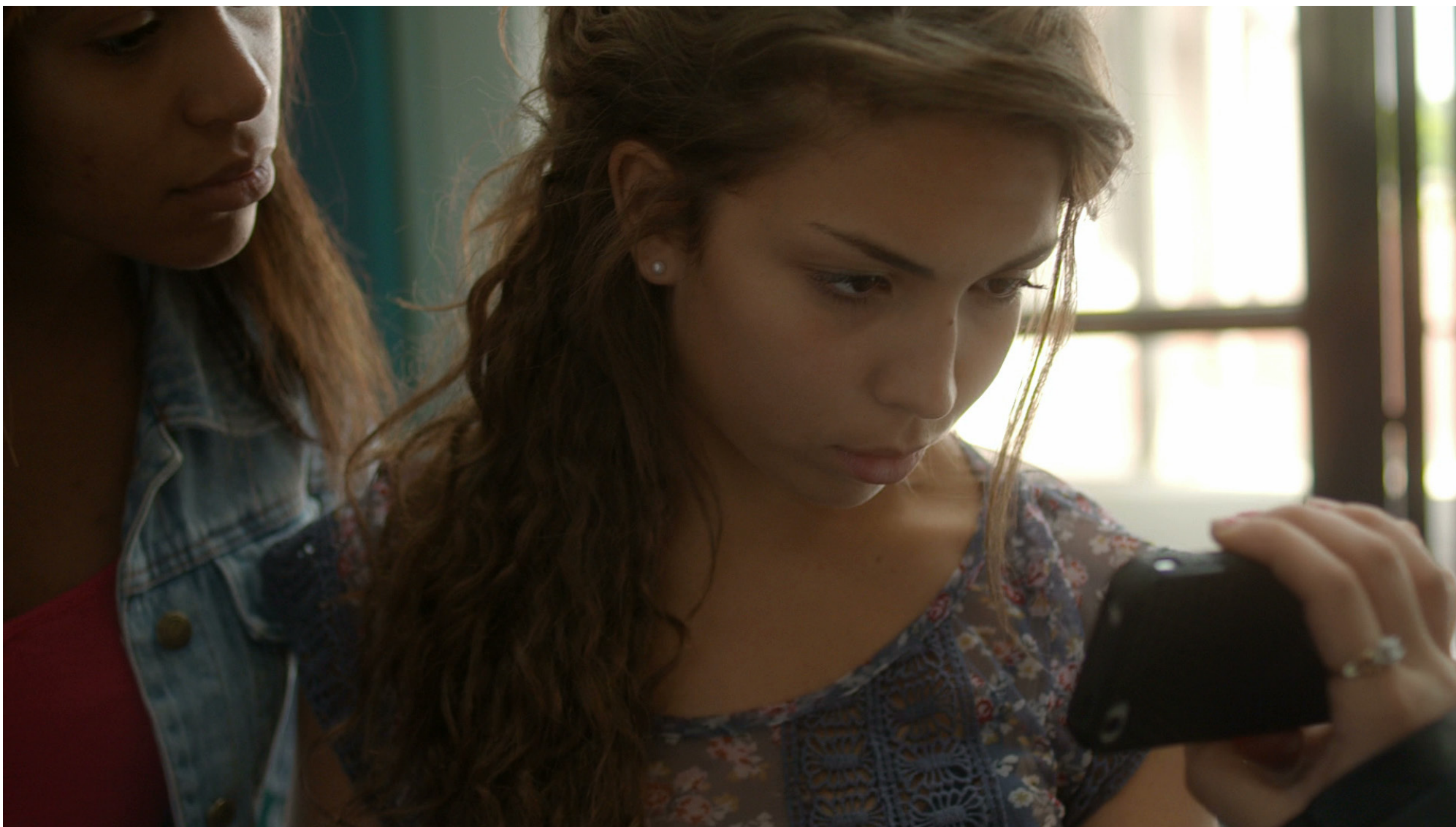
→ Leila découvre la vidéo qui circule sur sa sœur