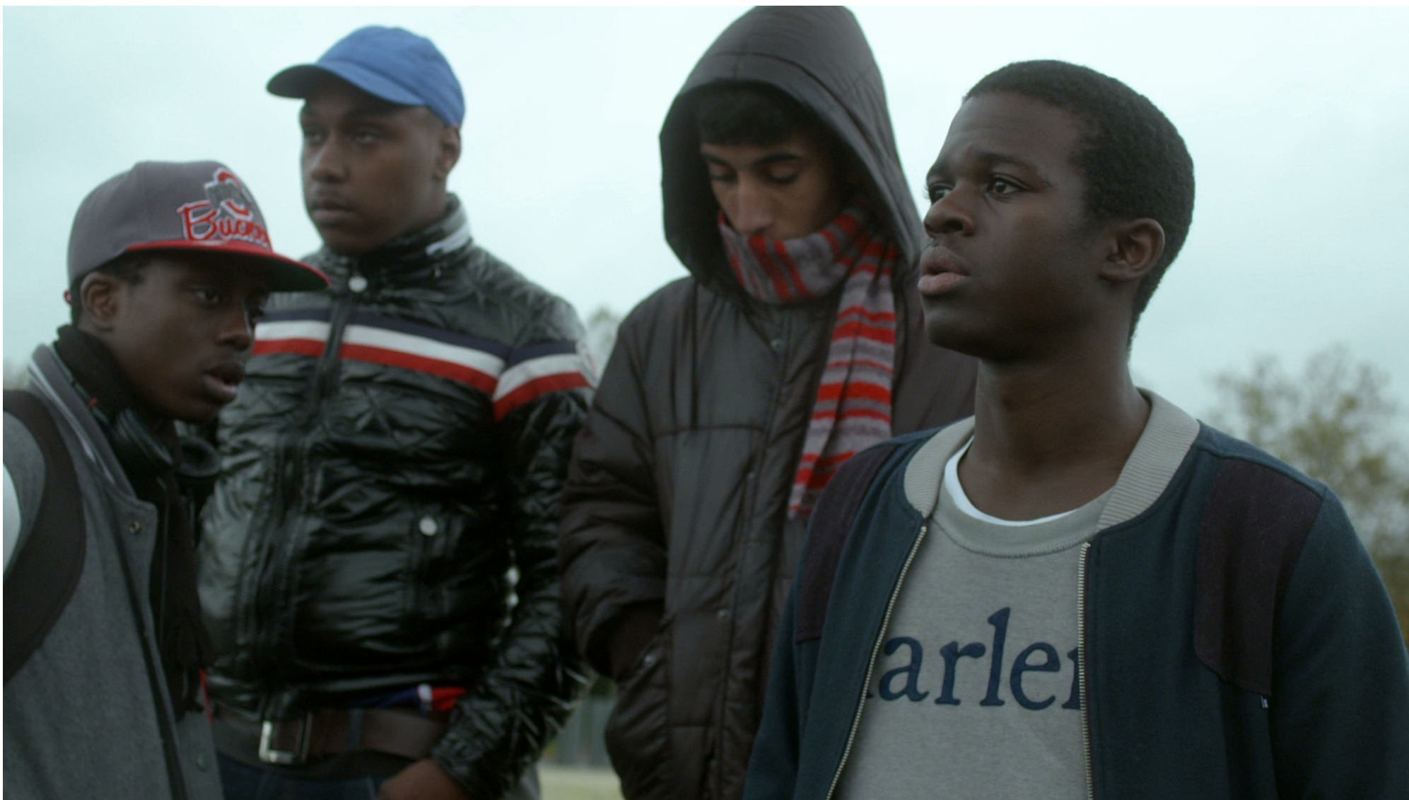
→ Les jeunes du quartier après la bagarre.