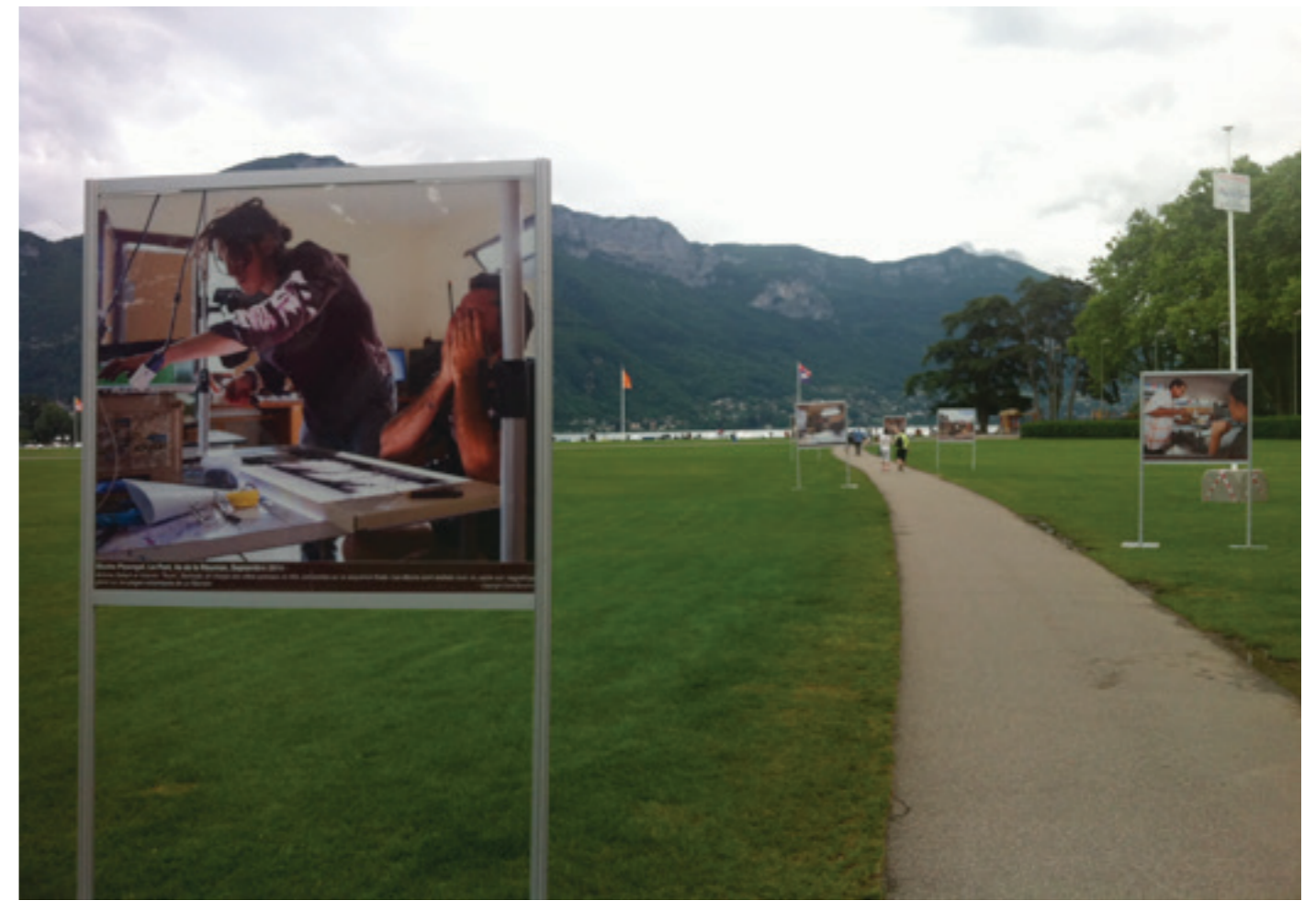
EXPOSITION ANNECY 2015