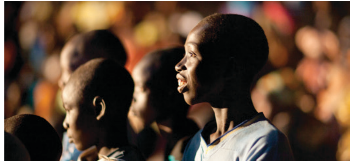
AFRIKABOK 2016, festival itinérant le long du fleuve SÉNÉGAL, projection d'ADAMA dans une vingtaine de villages