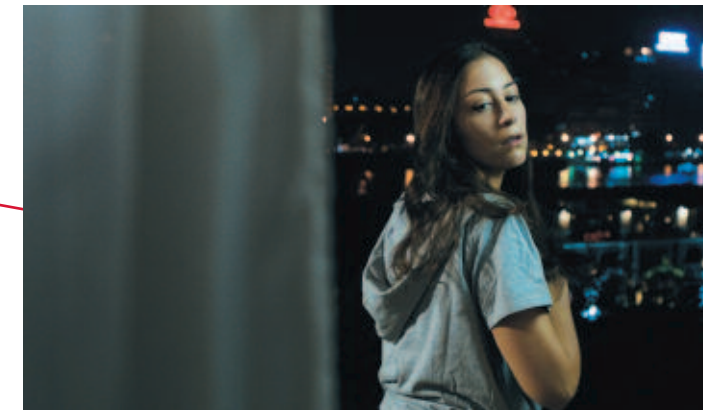
Chez Reem, dans les beaux quartiers de Zamalik.