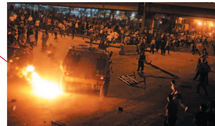
La répression sanglante de la manifestation de Maspero.