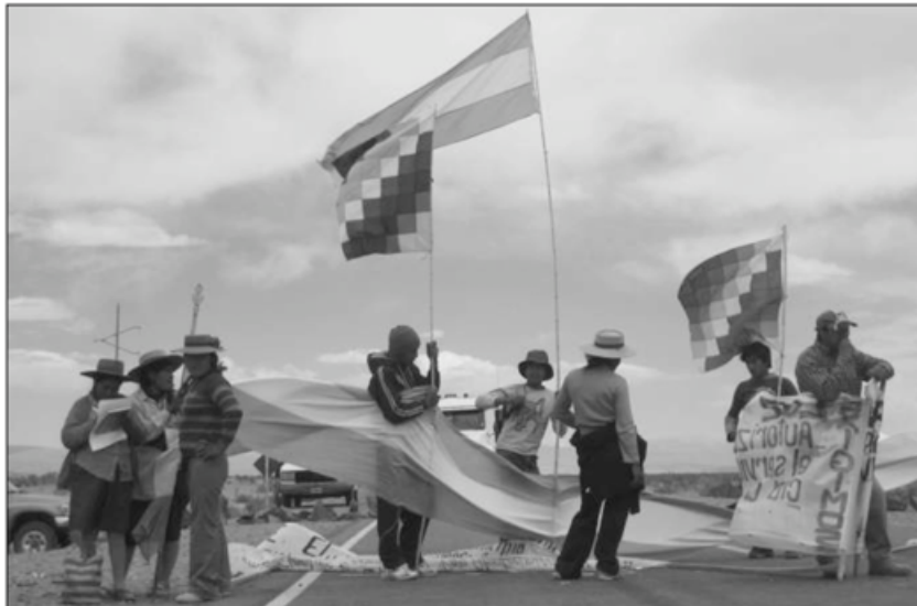
Des Kollas coupent une route: A ciel ouvert suit la lutte de ces indigènes argentins dans une région dominée par la mine. I. COMPAN

Alors que les Kollas manquent d'eau, la compagnie minière pompe les nappes phréatiques. Celle-ci se défend en arguant qu'elle recycle l'eau. Mais la perte est tout de même de 30%, ce qui est énorme pour la région. Comme la mine est à ciel ouvert, les poussières contaminent l'air et l'eau. Mais pour moi, l'impact le plus fort est social. La lutte use psychologiquement. La mère de David, la bergère qu'on voit dans le film, a été harcelée pendant deux ans pour qu'elle quitte sa maison et change de lieu de pâture pour ses lamas. Elle en est tombée malade. Au niveau des communautés, l'entreprise tente de diviser pour régner. Le maire du village a été élu car il a pu promettre à ceux qui allaient voter pour lui qu'ils au-