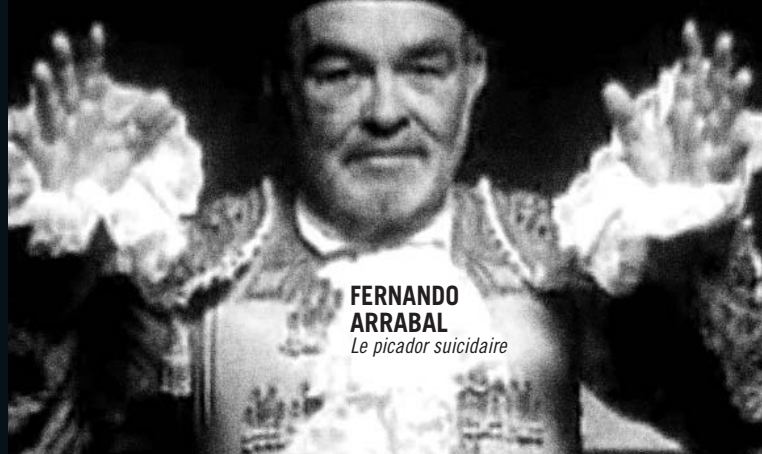
FERNANDO ARRABAL Le picador suicidaire