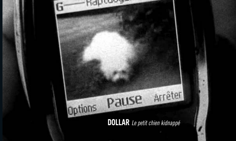
DOLLAR Le petit chien kidnappé