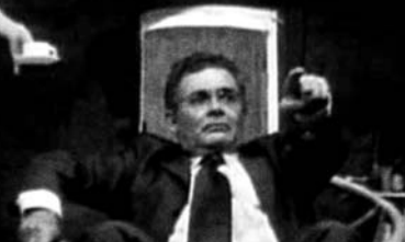
ALAIN MAGNAN Le pourvoyeur d'esclaves