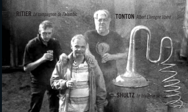
RITIER Le compagnon de l'alambic