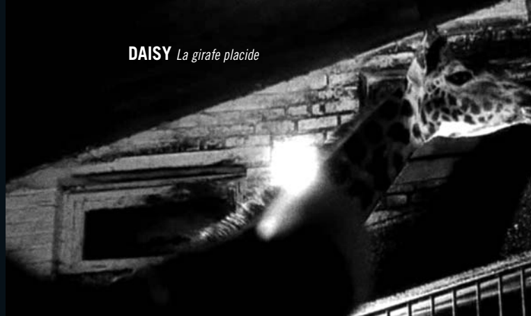
DAISY La girafe placide