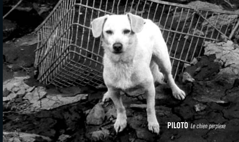
PILOTO Le chien perplexe