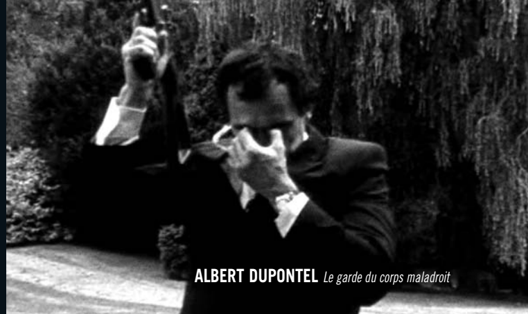
ALBERT DUPONTEL Le garde du corps maladroit