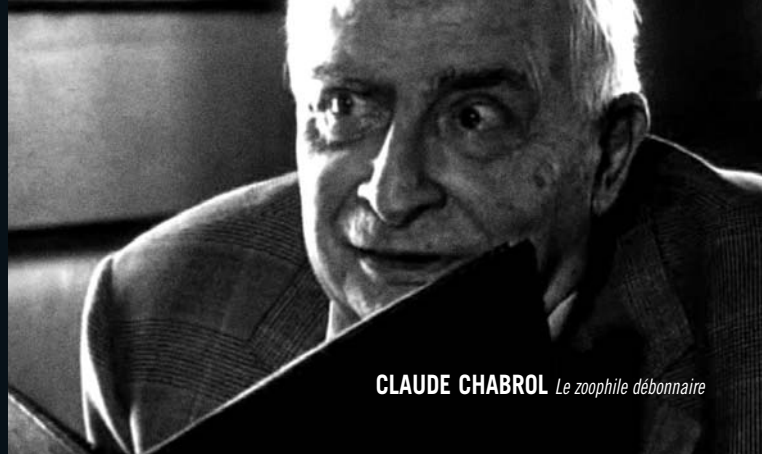
CLAUDE CHABROL Le zoophile débonnaire