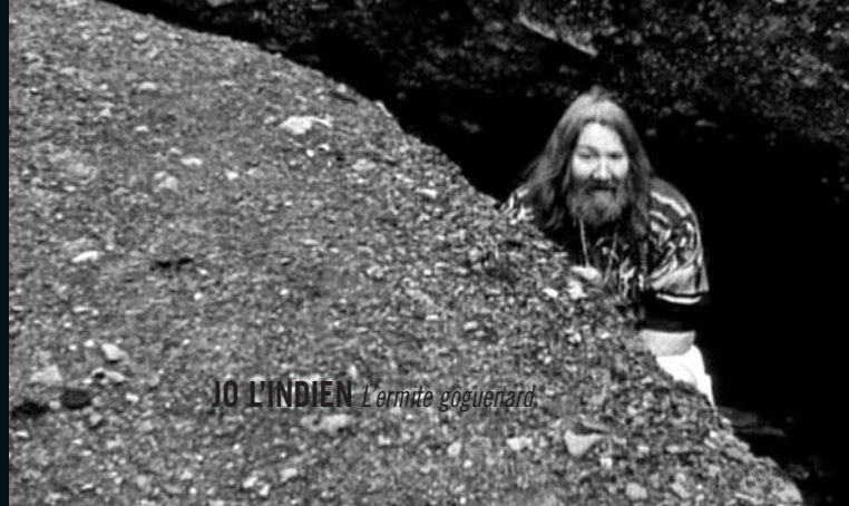
JO L'INDIEN L'ermite goguenard.