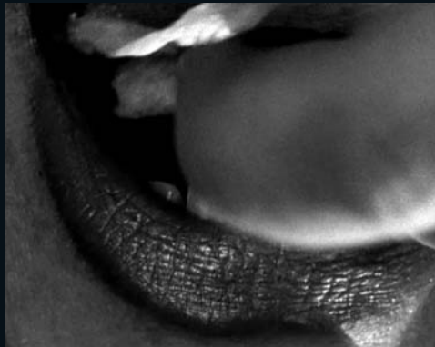
ROKIA TRAORÉ La chanteuse bienveillante