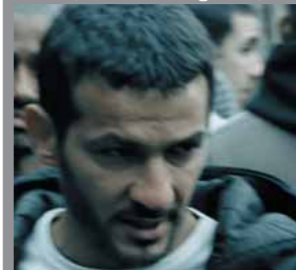
Aziz est un terroriste.

Derrière son apparence de petit caïd de prison, Aziz est un recruteur salafiste au service d'Al Barad. Sa mission ? Identifier les proies susceptibles de devenir des kamikazes. Il devient le mentor de Pierre pour mieux l'endoctriner et le pousser petit à petit vers l'islamisme radical.