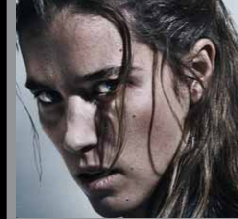
Diane est une victime.

Diane est une « proie » idéale pour un service de renseignements : belle, ambitieuse, sans attaches familiales, solitaire, séductrice et fragile.