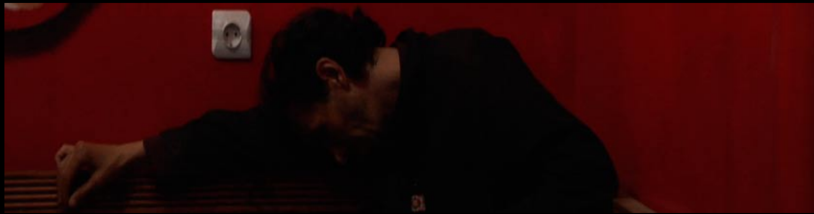
table des navigations